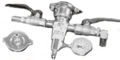
Pressure Tester/ Coolant Dams