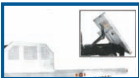
Plate-forme complete installé sur camion avec coffres