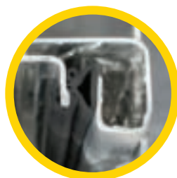
Construction FGI (fabrication gouttière intégrée)