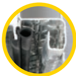
Joint d'étanchéité en caoutchouc de type automobile